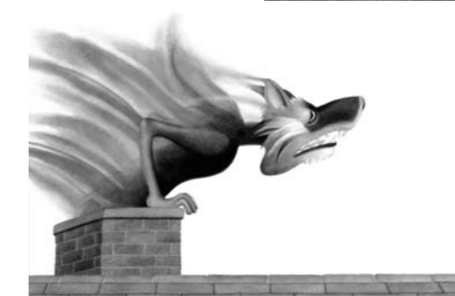
Étienne Delessert : Grand Méchant , Gallimard Jeunesse