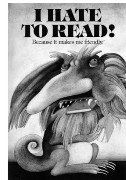
« I hate to read ! », aquarelle et crayon, 1983, affiche, Creative Education, in : Étienne Delessert, Delpire (Poche illustrateur). © Etienne Delessert