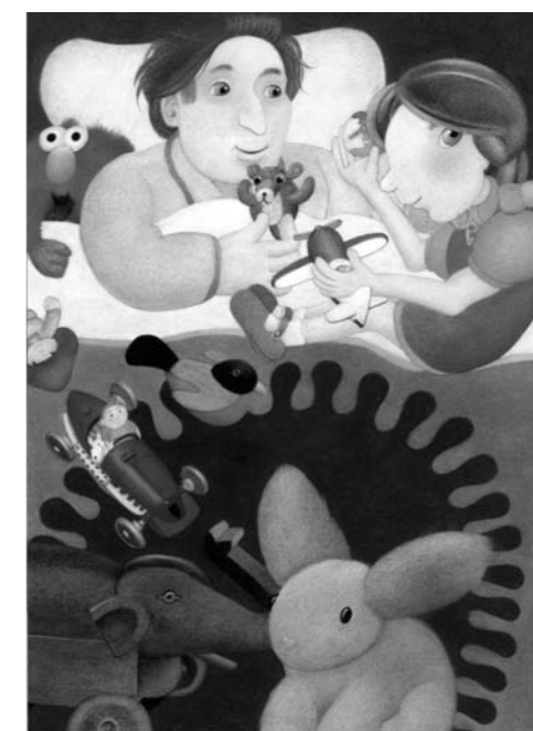
Eugène Ionesco, Étienne Delessert : Contes 1.2.3.4 , Gallimard Jeunesse. (Conte n°3, p. 84)