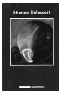
le volume de la collection « Poche illustrateur » des éditions Delpire consacré à Étienne Delessert