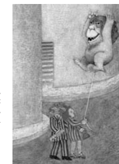
Eugène Ionesco, Étienne Delessert : Contes 1.2.3.4. Gallimard Jeunesse. (Détail p. 20)