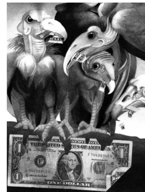
Une page de Siné Hebdo , reproduite dans Pourquoi grandir ? , catalogue de l'exposition du Centre de l'illustration de Moulins, consacrée à Étienne Delessert

E.D. : Siné Hebdo , ça remonte à très longtemps... Quand j'avais quatorze ans, ma mère m'a offert mon premier livre de Steinberg, publié par Gallimard. Au fond, à cette époque je ne m'intéressais pas au dessin mais plutôt à comment communiquer des idées visuellement. Steinberg, André François que je connaissais par l'intermédiaire de la revue Graphis , et Siné dont j'ai découvert les dessins dans L'Express , m'ont montré comment on pouvait s'exprimer. Ils ont été mon école. Siné s'exprimait avec force à l'époque, car il s'attaquait à la torture en Algérie. Du jour où il a commencé à faire des dessins pour L'Express , alors qu'il avait rencontré un grand succès dans la publicité et l'édition, tout cela s'est évanoui. Les agences ne pouvaient plus le recommander, parce qu'il était devenu « dangereux ». Avec un certain courage, il a choisi un vrai langage politique. Je lui dois beaucoup. J'ai toujours suivi ce qu'il faisait, tant bien que mal, parce que j'étais d'abord aux États-Unis, puis en Suisse, et puis à nouveau aux États-Unis. Mais, en 2003, devant l'incroyable silence des médias face à la campagne de communication du gouvernement américain pour « vendre » la guerre en Irak à l'opinion publique, j'ai eu envie de faire un film documentaire, d'une heure,