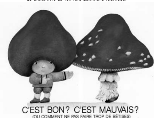
C'EST BON? C'EST MAUVAIS? (OU COMMENT NE PAS FAIRE TROP DE BÊTISES)